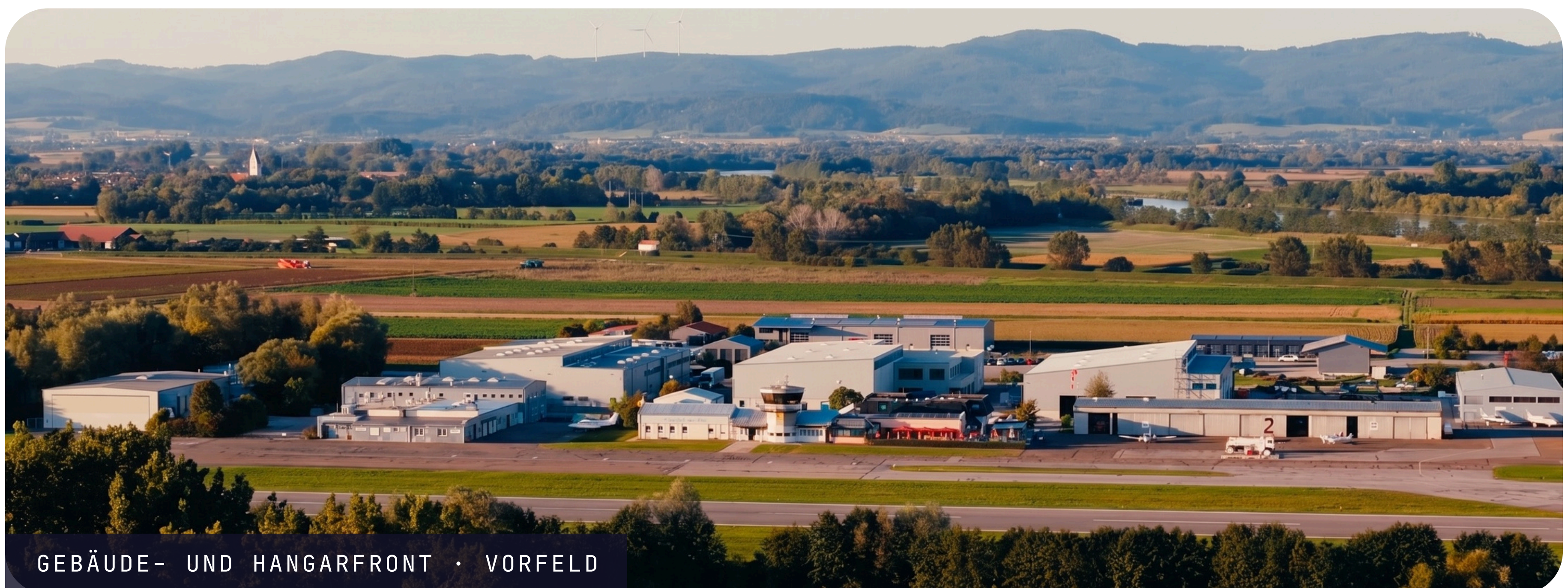
GEBÄUDE- UND HANGARFRONT · VORFELD